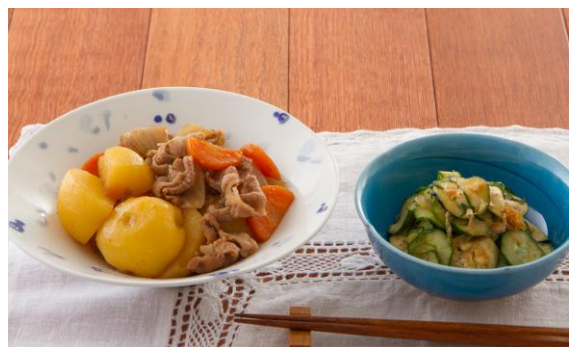
▲「また作りたい飯島さんの定番肉じゃが」 じゃがいものまわりは甘辛く、中はいもそのものの味が 楽しめる、ごはんが進む肉じゃがです。