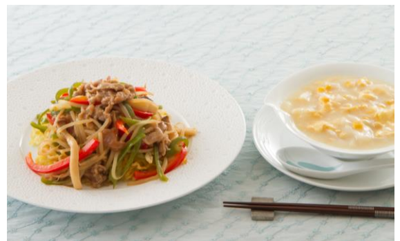
▲「五十嵐シェフ特製チンジャオ焼きそば」 香ばしいカリカリ焼きそばにたっぷりのチンジャオ ローズを合わせて。