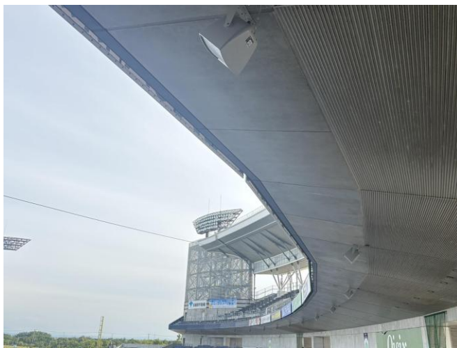
▲球場屋根部分に分散して設置している様子