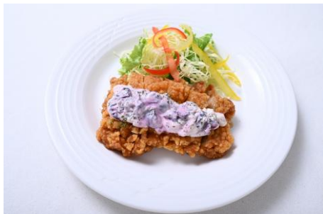
▲ブルーベリータルタルチキン南蛮