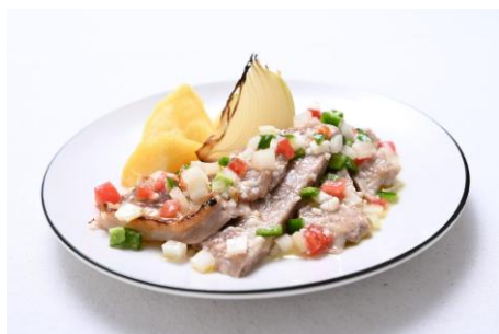
▲塩麴ポークロースト フレッシュトマトサルサ仕立て