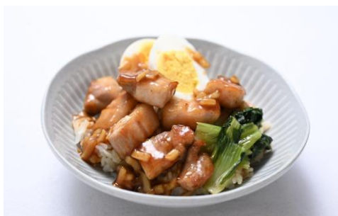
▲八角香る本格ルーローハン