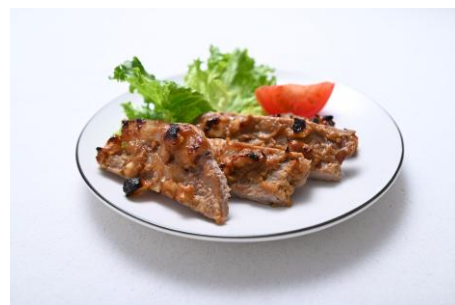
▲ザクザク味噌ナッツの ポークステーキ