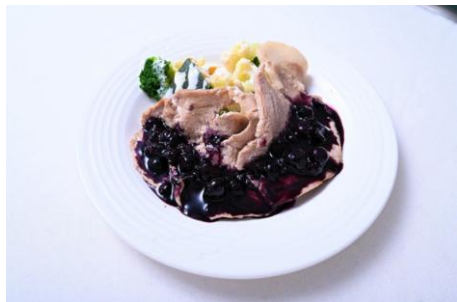
▲豚ロースのソテー ブルーベリーグレービーソース