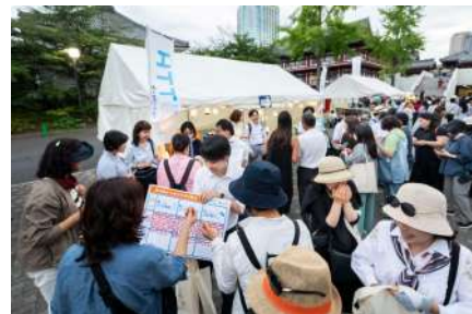
▲2025年度東京都環境局ブースの様子

また、今年は小学生の親子を対象にソーラーランタンをデコレーションして灯りを点け、癒されながら環境について考えるきっかけを提供する「ソーラーランタン★デコ体験」ブースを設置します(事前抽選にて当選された方が対象。※参加者募集は終了しています)。