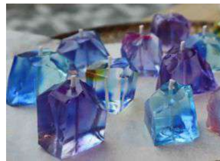
▲アロマキャンドル(昨年開催時のもの)