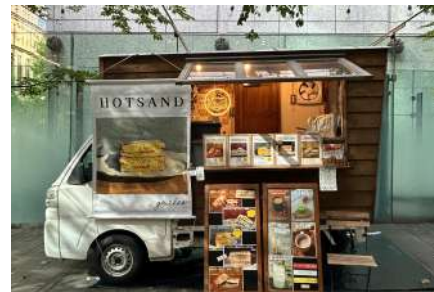
▲キッチンカーイメージ (grichee)

また、「大地を守る会」ブースでは、規格外や豊作の野菜/果物を販売している「大地のもったいナイ豊作野菜セット」の展示や、「大地を守る会」契約生産者の方々の想いを伝えるパネル展示スペースも併設いたします。