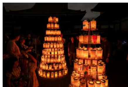
▲キャンドルツリー(2025年開催時)

こちらで寄せられた寄付金は「大地を守る第一次産業支援基金」を通して「日本の第一次産業を守り育てることを目的として活用されます。(参加費1000円のうち、500円が寄付に充てられます。)