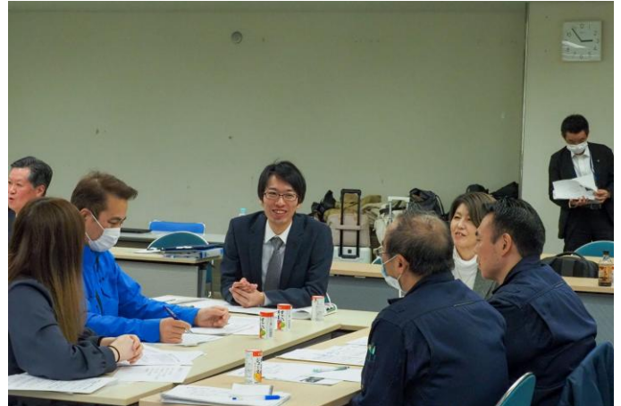
▲グループディスカッションの様子