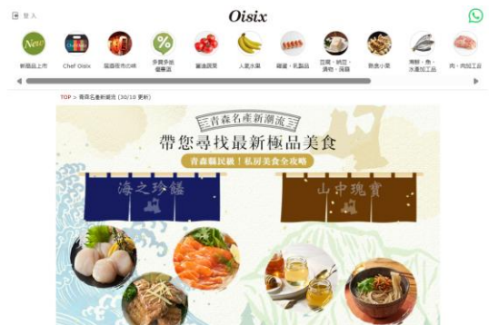
▲Oisix香港での青森県フェア

一般的な輸出事業においては、実際の購買者の評価やニーズを把握することは難しいケースがある一方、当社は食品宅配サービスのお客さまから定量・定性のデータを収集することが可能です。データをもとに事業者ごとのレポートを作成し、価格設定や商品仕様、訴求方法の改善に向けたフィードバックを行っています。単なる販売機会の提供にとどまらず、継続的に“売れる商品”へと進化させる支援を実現しています。