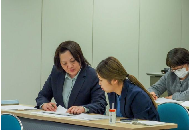
▲ワークショップの様子

参加事業者によるワークショップおよびグループディスカッションを実施し、アンケート結果を踏まえた輸出戦略の見直しと今後の目標設定を行いました。参加事業者からは「非常に貴重なデータであり、今後の戦略設計に役立てたい」「これまで把握しづらかった現地のお客さまの生活や嗜好を具体的に理解することができた」といった声が寄せられたほか、「長年課題であった価格についても一定の手応えを感じられた」といった変化を実感する声も聞かれました。表彰式では、当社から各事業者に向けて、繁体字での表彰状を贈り、益々の活躍を祈念しました。