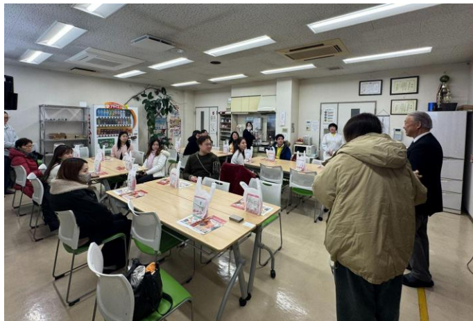
▲青森県の実産者ツアーの様子（2025年12月）