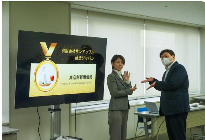
▲成果報告会の様子（左：栃木県、右：青森県）