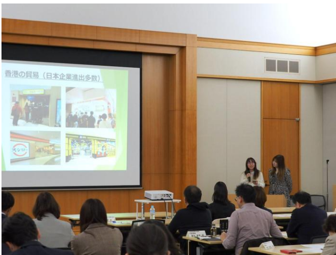
▲成果報告会の様子

参加事業者からは「お客さまの生の声が聞けたことはありがたく、今後のアクションに活かそう」「今後も香港市場で販売を継続するための貴重なモニター結果になった」といった声が寄せられ、県担当者からも「オンラインとオフラインの両面で検証できた点は大きい」と評価されています。