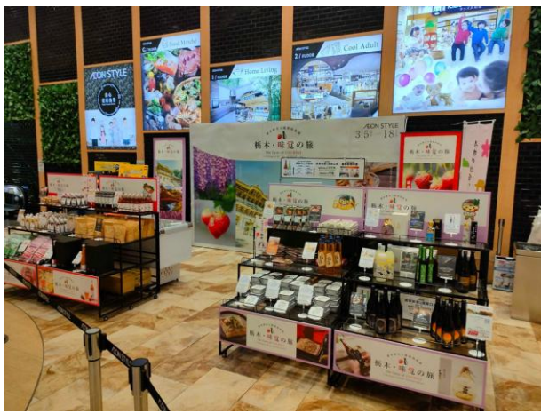
▲香港でのオフライン販売