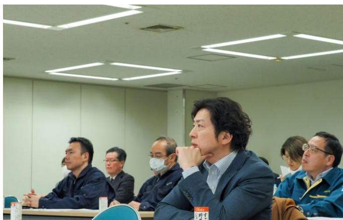
▲成果報告会の様子