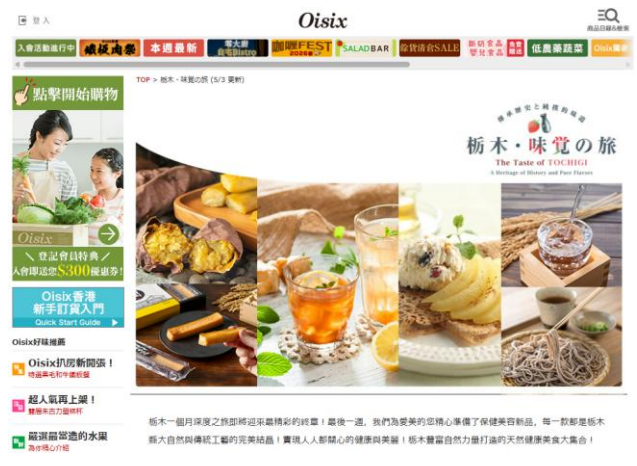
▲Oisix香港での栃木県フェア