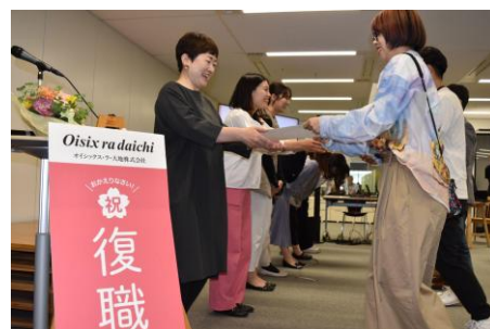
▲復職証書の授与（2025年）

公式note URL : https://note.com/oisixradaichi/n/n7a1ae2ca734a