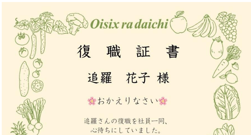
▲復職証書のテンプレート

あわせて、復職後の負担軽減を目的に、当社が運営するOisixが展開する、温めるだけで食事が完成する夕食サービス「デリOisix」のおためしセットを、春の新生活応援キャンペーンの一環として、2026年4月2日（木）より販売します。