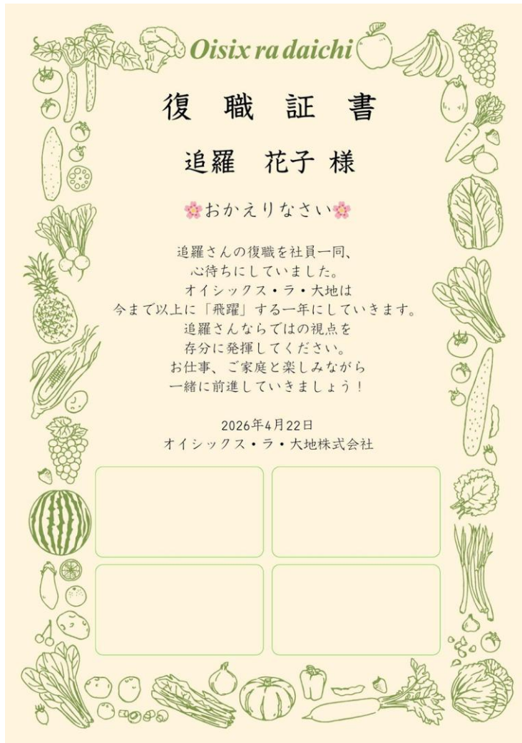
▲公開している復職証書例