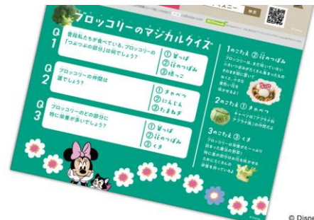
▲（左から）ランチョンマットとピック、コップの蓋とチャーム、ブロッコリーにまつわるクイズ