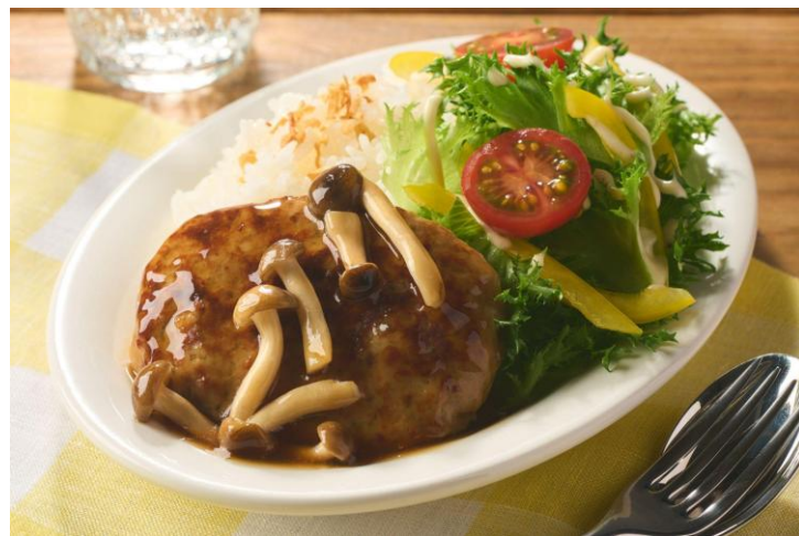
▲【超ラク】旨みたっぷりテリヤキバーグボウル