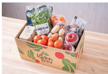
▲豪雪産地支援！ ふぞろい食材おためしセット （イメージ画像）