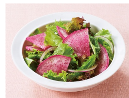
▲調理例 紅くるり大根のサラダ