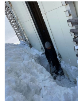
▲倉庫扉前の雪を 掻き出す様子 (2024年撮影)