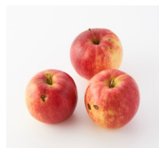
▶ほくろりんご （イメージ）

らでいっしゅぼーやは、これまでも天候災害の際など、生産現場が直面する困難に対し支援を行ってまいりました。今回の深刻な「雪害」も、生産者がその土地で農作物を作り続けていく上で見過ごせない状況だと捉えています。この課題に対し緊急支援として1回のご注文あたり100円寄付ができる「ふぞろい食材おためしセット」を販売します。（ご購入はお一人1回まで）