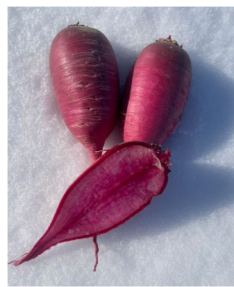
▲紅くるり大根 （イメージ）