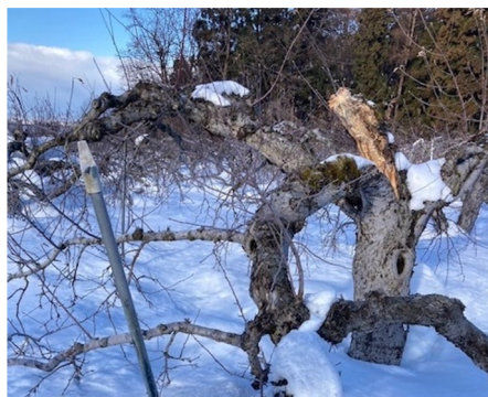
▶（青森）雪の被害で折れてしまったりんごの木

食品のサブスクリプションサービスを提供するオイシックス・ラ・大地株式会社（本社：東京都品川区、代表取締役社長：高島宏平）が展開する「らでいっしゅぼーや」は、記録的な豪雪に見舞われている契約産地（長野県北信地域・青森県津軽地域）の生産者を支援するため、寄付金付きの食材おためしセット「豪雪産地支援！ふぞろい食材おためしセット」を2026年2月16日（月）より販売開始します。厳しい雪害にあっている青森県のりんご生産する「新農業研究会」「津軽産直組合」、長野県で紅くるり大根を生産する「あいこう農園」へ売上の一部を寄付いたします。 https://www.radishbo-ya.co.jp/admission/lp/trial/