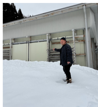
▶（長野）紅くるり大根を保管する倉庫付近の様子 出荷の度に扉入口前の除雪作業を行う