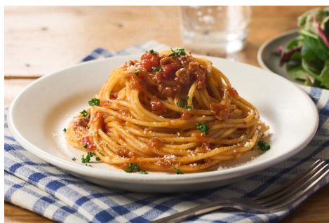
▲レンジで簡単! 定番ミートソースパスタ

寒い冬の季節にご自宅で楽しめるラインナップとなり、おうちの食卓で本格的なイタリアグルメを楽しめます。商品は100種類以上、ミールキットのKit Oisixが7種類販売予定です。新商品は、レンジでチンするだけで簡単に仕上がる定番ミートソースパスタ、トマトとエビのリゾットの素、ミラノ風カツレツ、正統派イタリアビールのモレッティなどが登場します。Kit Oisixは「イタリア気分で! アラビアータポーク」、「モッツアレラチーズのマルゲリータ鍋」、「鶏のカチャトーラ風 バルサミコ仕立て」、「モデナ産バルサミコ酢とチーズのサラダ」など、過去に販売して人気のあったイタリア料理のメニューを7種類再販します。大人から子どもまで家族みんなで楽しめる商品を揃えました。