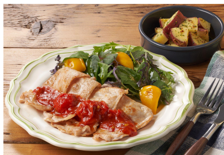
▲(Kit Oisix) イタリア気分で! アラビアータポーク