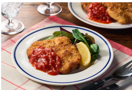
▲ミラノ風カツレツセット