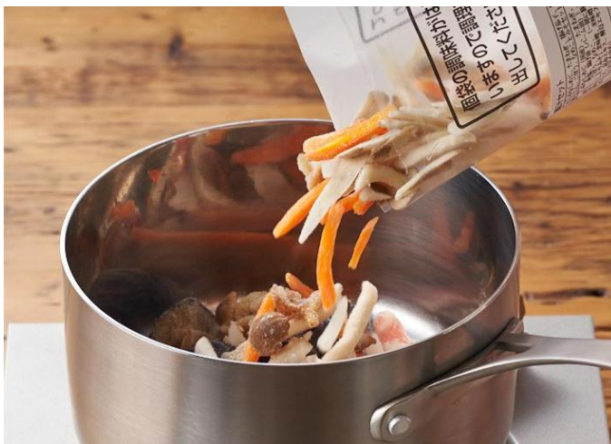
▲調理しやすさを追及し、具材の量も細かく調整済みです