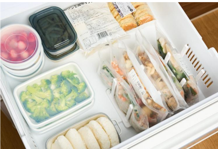
▲冷蔵庫にストックできる「〇〇をたすだけ」シリーズ

食品のサブスクリプションサービスを提供するオイシックス・ラ・大地株式会社（本社：東京都品川区、代表取締役社長：高島 宏平）が展開する「Oisix」は、2026年1月15日（木）より、冷蔵庫にある食材を足すだけで完成するおかず「〇〇をたすだけ」シリーズを20品に拡充して販売開始します。昨今の物価高がご家庭の食卓事情を圧迫する中、1年を通じて安定した価格で旬の時期に収穫した野菜がたっぷり食べられるオリジナルメニューの拡充により、毎日のごはん作りを応援します。 https://www.oisix.com/sc/tasudake