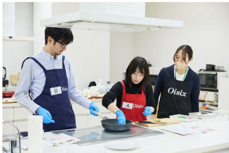
▲Oisix CookBoxを調理する参加者