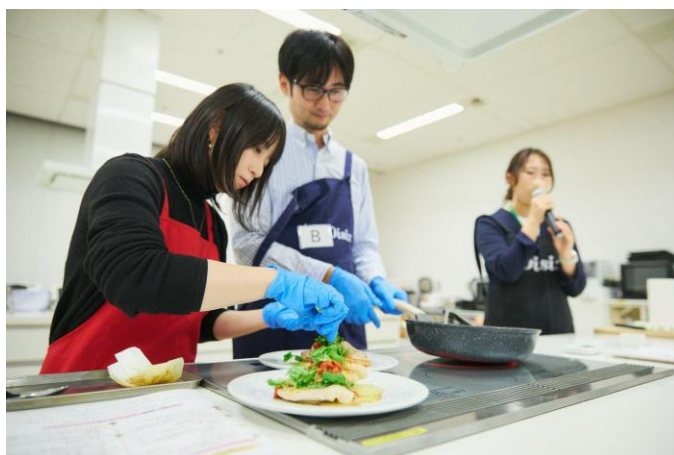
▲Oisix CookBox担当者によるサービス紹介と、参加者による調理デモンストレーション