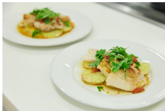
▲参加者が調理した「豚ロースソテーのスパイストマトソース」