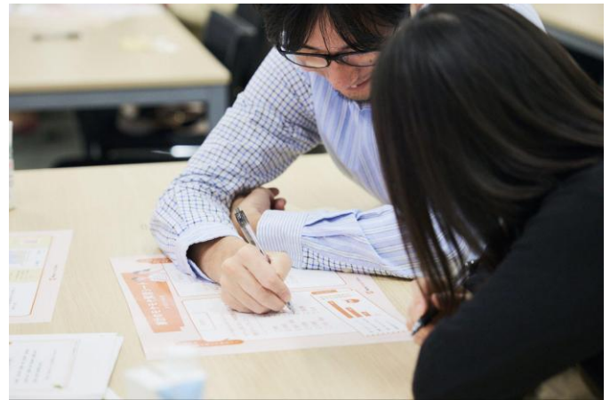
▲マネーフォワードホーム担当者によるサービス紹介と、家計の悩みを可視化するワークショップ