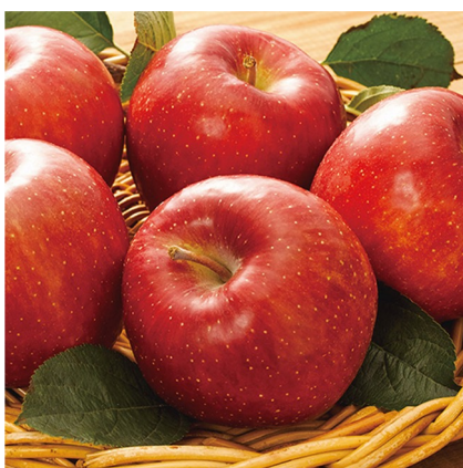
△りんご制覇 9～2月まで販売