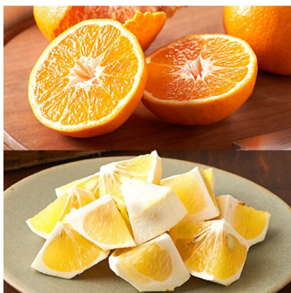
△かんきつ制覇 1～5月まで販売

食品のサブスクリプションサービスを提供するオイシックス・ラ・大地株式会社（本社：東京都品川区、代表取締役社長：高島宏平）が展開する「らでいっしゅぼーや」による果物や野菜の頒布会「制覇シリーズ」。旬の青果を少量ずつ楽しめるコンセプトが手軽にいろいろな品種を食べてみたいというお客様から好評で、前年比113%でご注文数が増えています。このような背景から、2025年はさらにラインナップを増やし、制覇シリーズを展開してまいります。