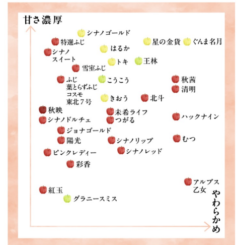
△らでいっしゅぼーや りんご制覇 味わいの違いチャート図

シナノリップ、つがる、彩香、秋映、トキ、清明、ぐんま名月、北斗、むつ、星の金貨、こうこう、ピンクレディー、ジョナゴールド、シナノスイート、王林、シナノレッド、きおう、未希ライフ、シナノドルチェ、紅玉、秋茜、陽光、はるか、ハックナイン、葉とらずふじ、特選ふじ、コスモふじ、東北7号、グラニースミス、シナノゴールド、雪室ふじ