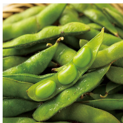
△お客様から大好評だった枝豆制覇