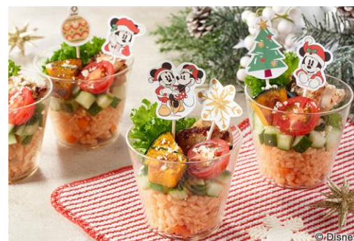
▲（上）<ミッキー>型ガイドを使った調理イメージ、（下）盛り付けアレンジ例