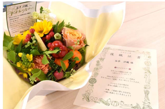
◀「おかえりなさい！」の声と共に渡された復職証書と、サプライズプレゼントのお野菜ブーケ