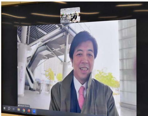
◀出張先の新潟からオンラインで参加し、コメントを送る