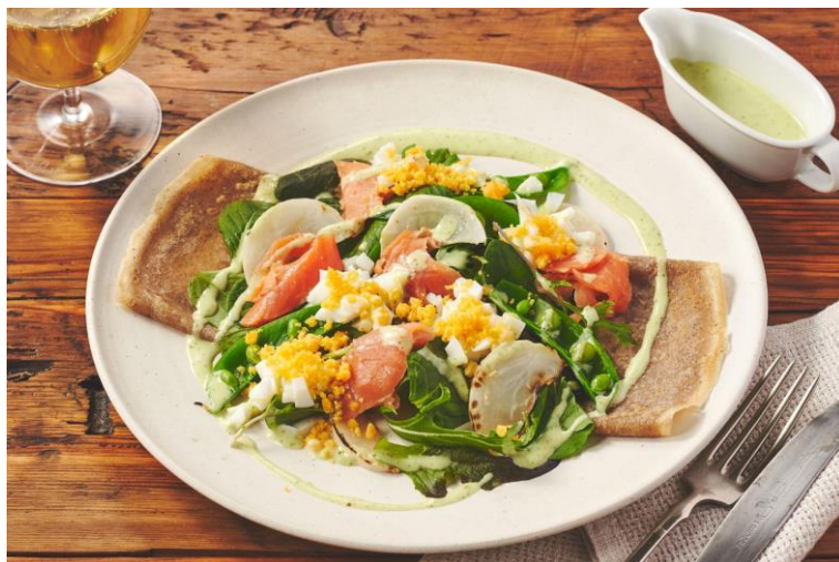
▲Kit Oisix「春気分で楽しむ！そば粉のミモザガレット」の2つの盛り付けパターン