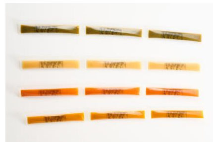
▲（上から）「国産野菜ペースト4種セット」利用イメージ、セット内容