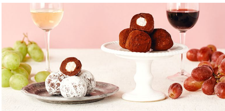
▲「山梨ワイナリーから生まれた 濃厚生チョコトリュフ(赤)、(白)」