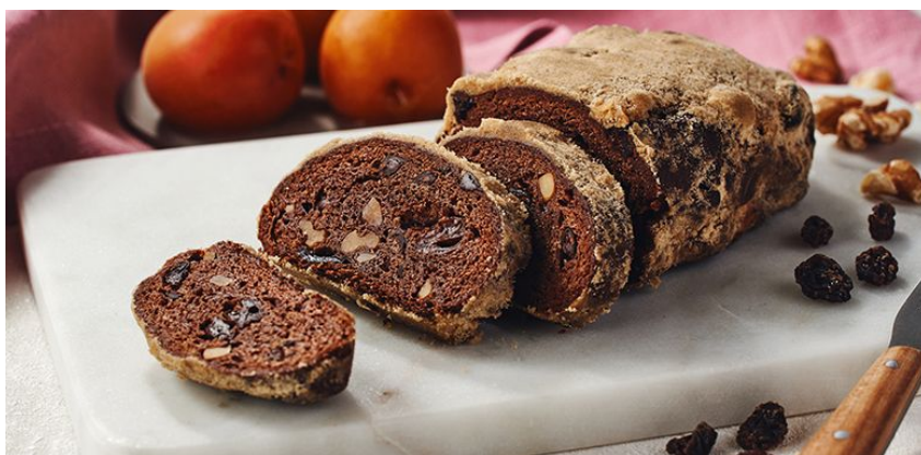
▲「梅酒から生まれた 濃厚ショコラシュトレン」