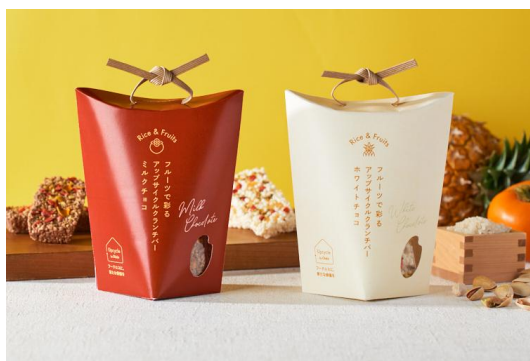
▲「フルーツで彩る アップサイクルランチバー」のパッケージ

食品ロス削減量:本商品1箱(4粒入り)あたり約1.2gのワインパミスを使用しています。