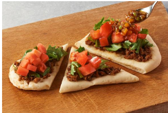
Oisixオリジナルのプラントベースミート（P肉）

第二弾となる今回はOisixオリジナルのプラントベースミート（P肉）を使用し、モスバーガーで復活リクエストのお声が絶えない伝説メニュー「ナンタコス」をミールキット化。販売時の懐かしい味わいを残しながらもプラントベースミートだからこそ表現できる、最後まで飽きのこない味わいに仕上げました。