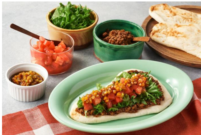
▲Kit Oisix「モス監修P肉ナンタコス」