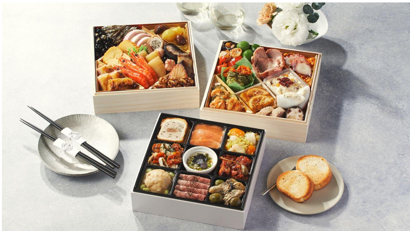
▲【Oisix】高砂×DEAN & DELUCAオードブル