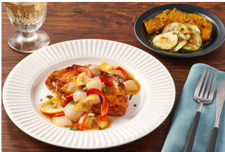
▲Kit Oisix「豚肉のハリッサソテー レモンソース」