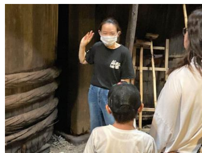
▲手作りウインナー作り教室、醤油の蔵見学の様子（協力：鎌倉ハムクラウン商会、松本醤油商店）