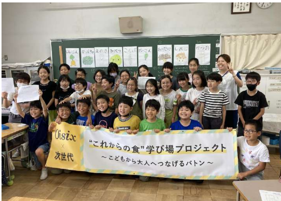
▲小平第六小学校での特別授業後の集合写真

また、当社では、今私たちに出来る環境負荷削減を進めると同時に、次世代を担う世代に学ぶ機会を提供し、学生が主体でアクションを起こせること、そして、そのアクションが大人たちの心を動かし、大きな行動変容につながることを目指し、「Oisix × 次世代 “これからの食” 学び場プロジェクト」を実施してまいります。