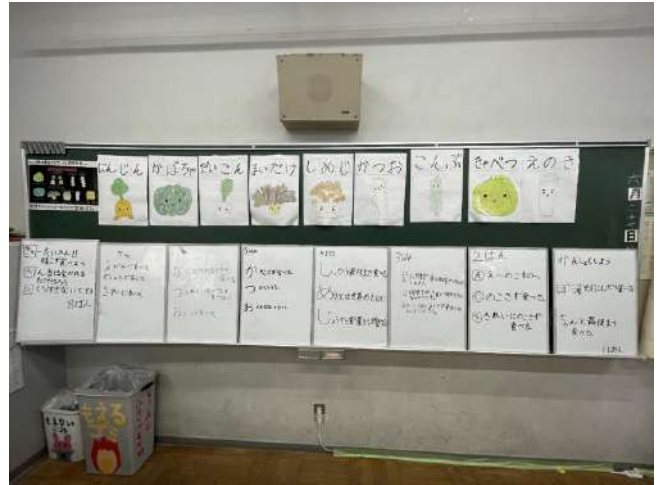
▲子どもたちが作成した“食品ロス削減マイルール あいうえお作文”