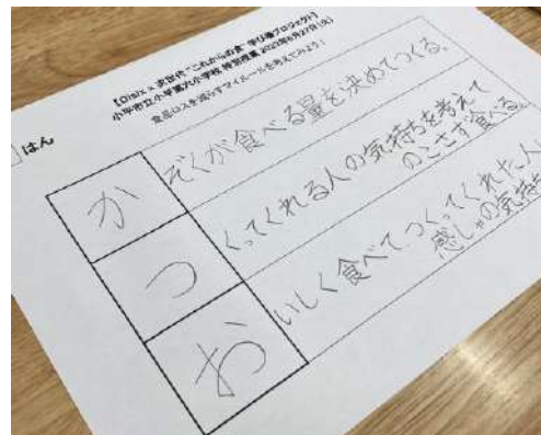
▲子どもたちが作成した「あいうえお作文」

食品ロスについて学んだ後、通常は廃棄されるがまだ食べられる食材をテーマにした、食品ロス削減マイルール あいうえお作文”に挑戦。各クラスで選ばれた作品の食材が、10月の食品ロス削減月間に、給食のメニューになって登場する予定です。