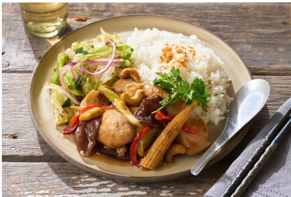
▲Kit Oisix「五香鶏飯プレート」

URL： https://www.oisix.com/sc/gokokeihan/