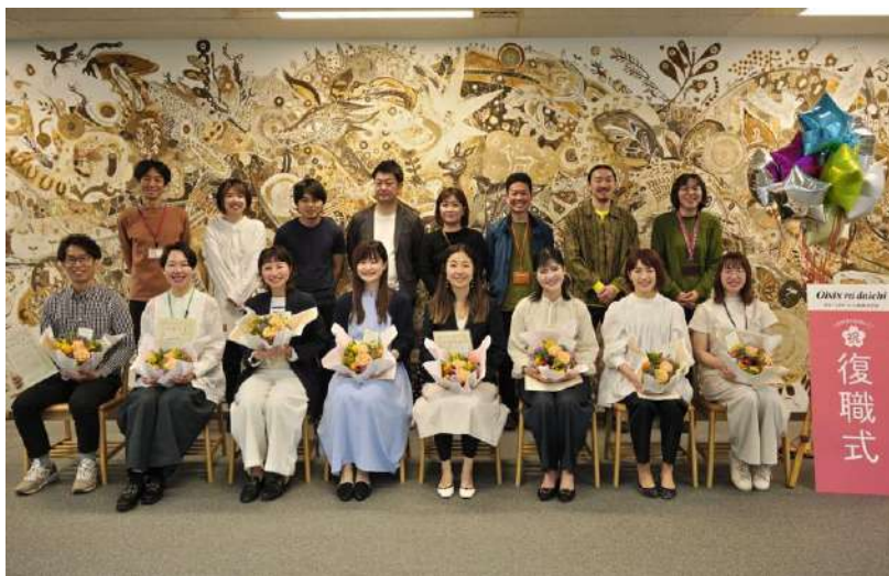
▲オイシックス・ラ・大地 2023年度「復職式」集合写真

また、「復職式」にとどまらず、当社ではアフターコロナにおけるインターナルコミュニケーションの施策として、オフラインの取り組みを充実させていきます。