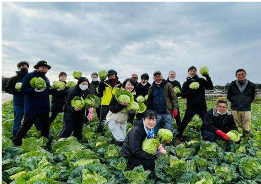
▲「畑の体感研修」の様子