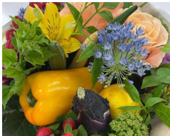
▲野菜でつくった「ベジタブルブーケ」をプレゼント