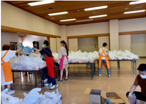
▲支援団体での食品配布風景

取り組みをさらに加速すべく、オイシックス・ラ・大地が運営する「Oisix」の定期会員のお客様には寄付付き商品の販売を開始。集まった寄付金は、食品物資の倉庫費用や支援団体への配送費、物資の購入費用に活用予定です。今後もさらなるサポート企業や支援団体の参加を呼びかけながら順次支援を拡充していきたいと考えています。