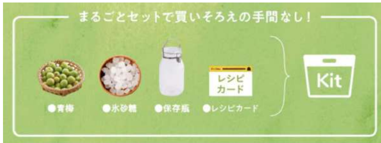
▲[梅2kg][ガラス瓶付]梅シロップKit のお届けイメージ

ふだん忙しい方でも、季節を身近に感じられたり、お子さまとのふれあいの時間をさらに大切にいただけるような、新たな価値のある商品をお届けします。