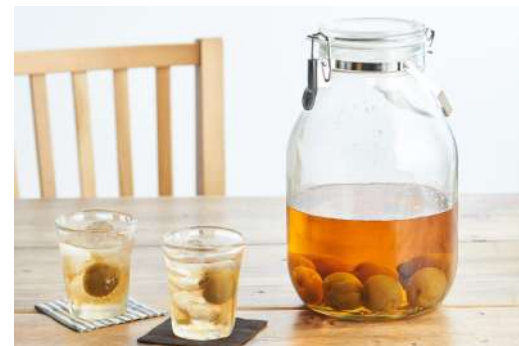
▲梅酒Kit(出来上がりイメージ)

※商品の性質上、また最適な状態でお届けするため、お届け予定が前後する可能性があります