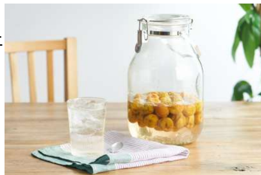
▲梅シロップKit(出来上がりイメージ)