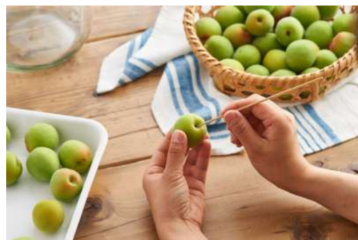
▲お子さまと一緒に取り組める工程も

商品詳細:梅のヘタを竹串で取るなど、お子さまにお手伝いいただける工程もあり、親子で一緒に取り組んでいただくことができます。工程を説明するレシピカードでは、出来上がった後のアレンジレシピや、漬けた梅を活用する方法などのご案内しています。