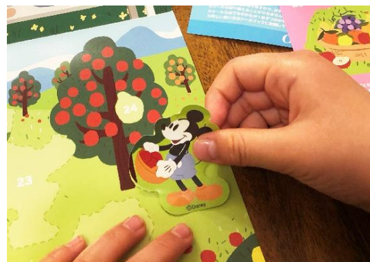
▲ディズニーデザイン「チャレンジシール」（左）と使用イメージ（右）