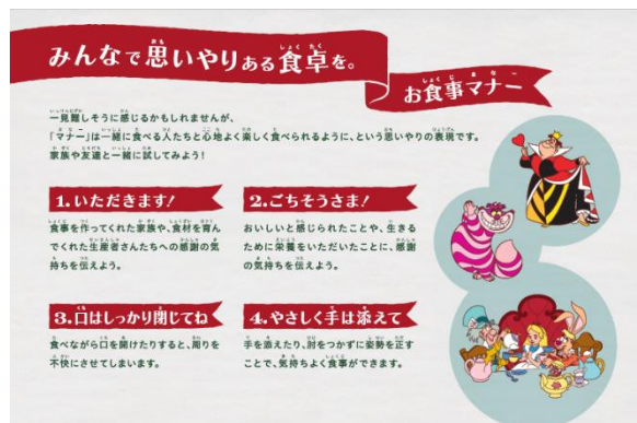
▲レシピに記載された「お食事マナー」(一部)