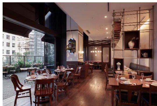
▲「富錦樹台菜香檳（フージンツリー）」 COREDO室町テラス店 店内

（植物を取り入れたアート作品）を配したクリエイティブ感とリラックスした雰囲気がブレンドされた居心地のよい空間で、日本向けにアレンジすることなく、厳選した台湾の食材や調味料を使用し、台北本店そのままの調理法で仕上げた本場の味を提供しています。