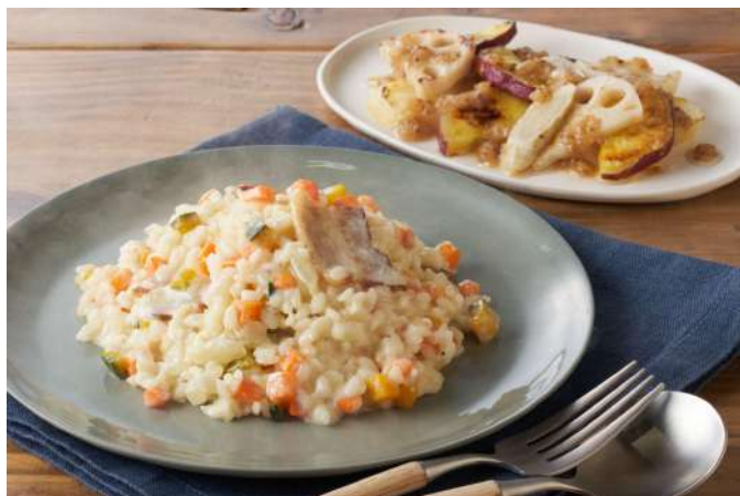
▲Kit Oisix「酒蔵応援・ベジチャウダー酒米リゾット」

食品のサブスクリプションサービスを提供するオイシックス・ラ・大地株式会社(本社:東京都品川区、代表取締役社長:高島 宏平)が展開する「Oisix」は、2021年9月23日(木)より、規格外品や端材(はざい)、災害や急な出荷停止で行き場を失った食材および、その食材を積極的にミールキットのメニューに活用した、Kit Oisix「酒蔵応援!ベジチャウダー酒米リゾット」、Kit Oisix「ふぞろいホッケのヤンニョン風味」を発売します。これは「サステナブルリテール」を掲げる当社が、環境問題対策として取り組むグリーンシフト戦略の一環として推進するものです。この2商品は、同日より開始する販売コーナー「Oisixもったいないマーケット」にて発売予定です。『Oisixもったいないマーケット』では、その他青果・加工品7アイテムも販売し、お客さまの反響などを踏まえながら、商品の拡大を検討してまいります(URL: https://www.oisix.com/sc/mottainaimarket )。