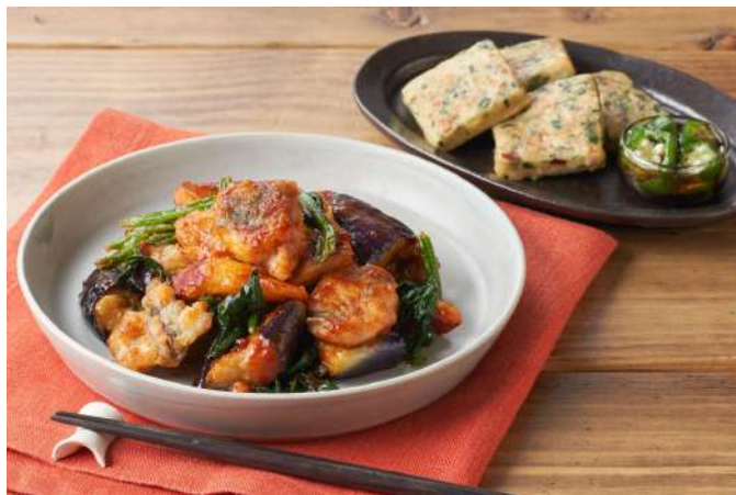
▲Kit Oisix「ふぞろいホッケのヤンニョン風味」