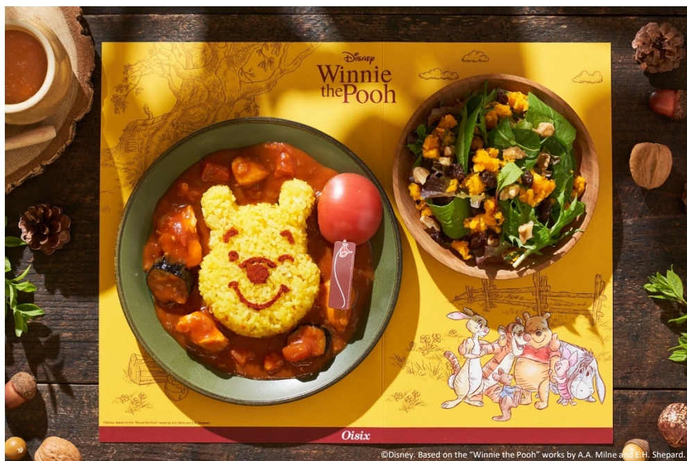
▲Kit Oisix [くまのプーさん] トマトカレー 商品画像

「くまのプーさん」は“100エーカーの森”という広い森の中でプーさんやその仲間たちがはちみつを探して楽しい冒険を繰り広げる物語です。大好きな仲間を思いやり、心を通わせ合うというストーリーを、現在の状況下において食卓を通して多くのお子さまに届けたいと考えております。