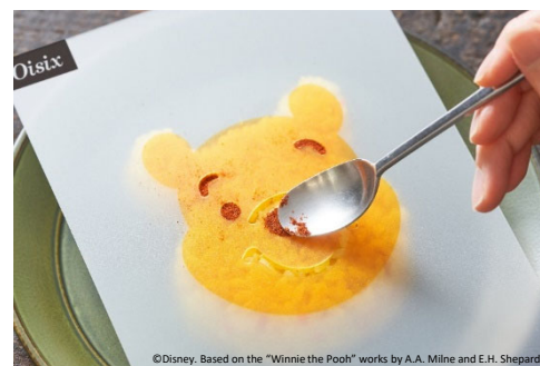
▲ステンシルシートで プーさんの顔を簡単に再現！

商品のテーマは「いつも、一緒だよ」。商品に付属するレシピカードやランチョンマットにはプーさんと仲間たちが一緒に楽しく冒険するシーンがたくさん描かれています。友達や大好きな人に直接会えない状況下でも、その人に思いを届けるきっかけになればと考え、プーさんのメッセージカードも付属しました。