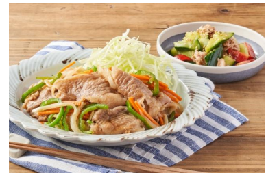
▲2018年監修のKit Oisix 「小倉優子の野菜たっぷり生姜焼き」

という理由から、“ママ代表”として、ママならではの視点をOisix商品・サービスに提供していただくため、2018年5月より「Oisixママサポーター」に就任いただいております。Oisix商品を共同開発していく(Kit Oisixのほか、お子さん向け商品など)、Oisixサービスをもっとママにとって使いやすくするべく一緒に改良していくといった取り組みをこれまでにやってまいりました。