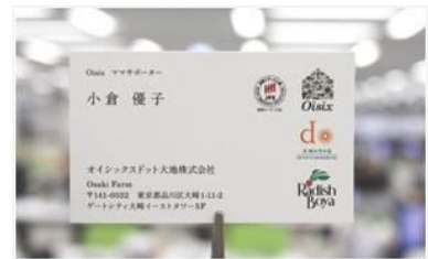
▲「Oisixママサポーター」の名刺