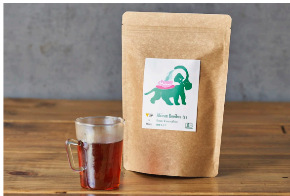
有機栽培アフリカン ルイボスティ（発酵） 作品コンセプト「ティーとゾウ」