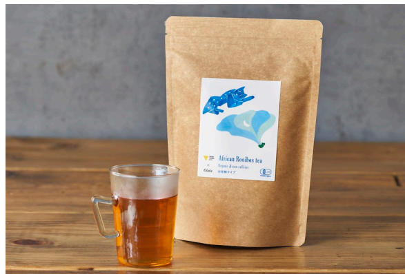
有機栽培アフリカン ルイボスティ（非発酵） 作品コンセプト「ティーとチーター」