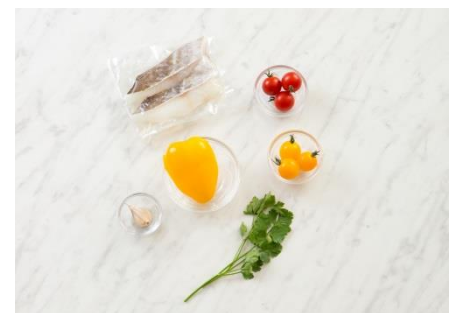
▲下準備された必要量の材料とレシピがセット