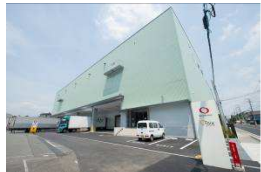
▲物流センター「Oisixステーション」