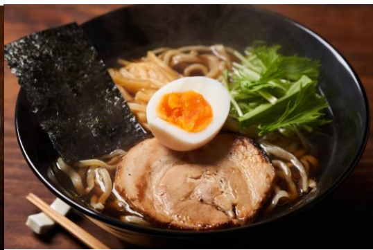
▲柚子醤油らーめん